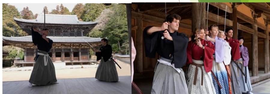
そして常行堂でラストサムライ本番体験!!