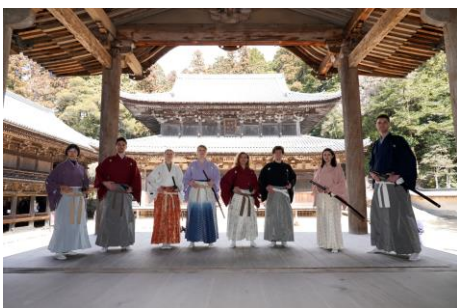
11:30頃 プログラム終了。