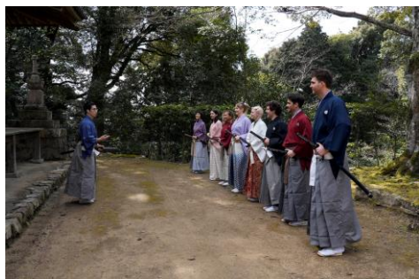
10:00 十地院で着替えて体験スタート!