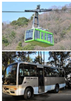
ロープウェー、 マイクロバスを 乗り継いで 圓教寺到着