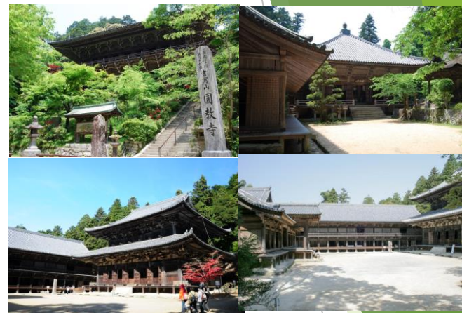
9:00より「書寫山圓教寺」ご案内(約1時間)