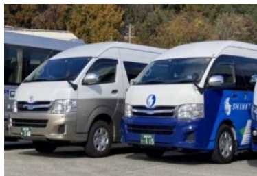
8:00 専用車にて姫路市内ホテル出発