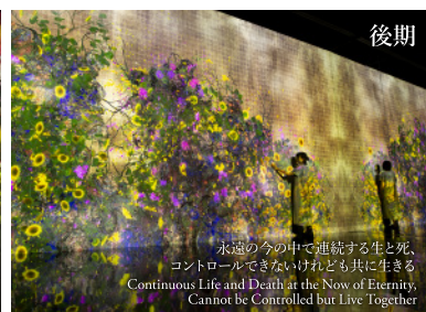
増殖する無量の生命 Proliferating Immense Life