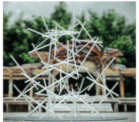
パビリオン《くぎくも》イメージ

「西の比叡山」とも称される書寫山圓教寺。この名刺を代表する「三之堂」と「摩尼殿」に触発された世界的建築家・隈研吾が、パビリオン《くぎくも》を制作・展示します。さらに、圓教寺の開基・性空上人と和泉式部の出会いの逸話をもつ「はづき茶屋」が、人々の憩いの場としていっそう親しまれるための将来像も描かれます。隈は、粒子や細胞のように小さな単位が集まったり離れたりすることで得られる生物的な「流れ」や「しなやかさ」を、大切なテーマのひとつにしています。《くぎくも》は、「散逸構造」と呼ばれる化学理論を手掛かりに、こうした考えを視覚化しています。1,000年を超えて守り育まれてきた圓教寺の偉大な歴史と遺産。それらとの対話を通じて隈が示す建築の未来は、我々が現在を生きるための多くの気づきを与えてくれるでしょう。