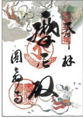
絵巻にちなんだ特別御朱印は摩尼殿と食堂で授与