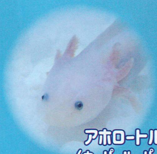
アホロートル (ウパールパー)