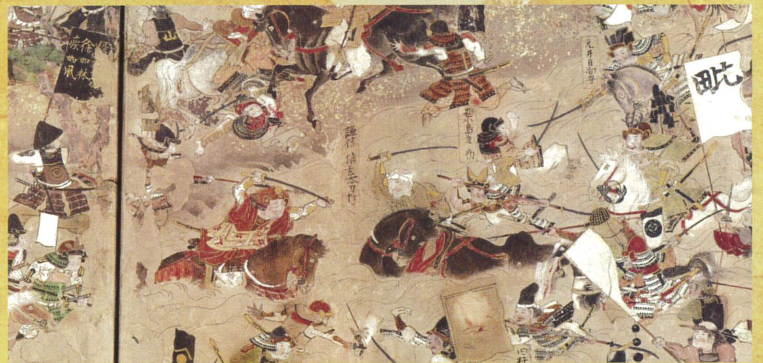
川中島合戦図屏風 右隻(部分、武田信玄と上杉謙信の一騎打ち) 江戸時代 和歌山県立博物館蔵 展示期間：5月20日(火)～6月15日(日)