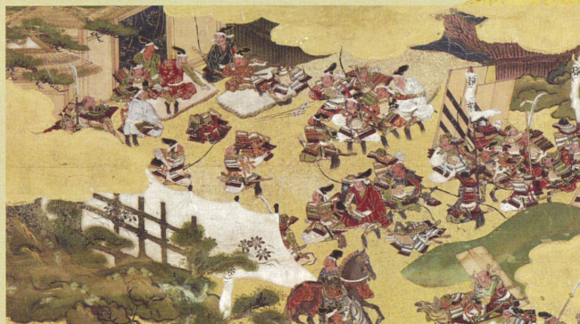
湊川合戦図屏風 右隻(部分、楠木正成の最期) 江戸時代 個人蔵、和歌山県立博物館寄託 ※展示期間：4月26日(土)～5月18日(日)