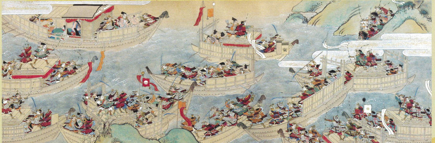
平家物語絵巻 巻第11中(部分、壇の浦の戦い) 江戸時代 岡山・林原美術館蔵 ※展示期間：5月20日(火)～6月15日(日)

開館時間：午前10時～午後5時(入館は午後4時30分まで) 休館日：毎週月曜日 ただし、5月5日(月・祝)は開館、5月7日(水)休館