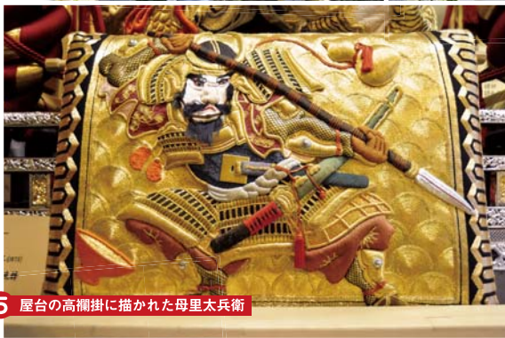
5 屋台の高欄掛に描かれた母里太兵衛