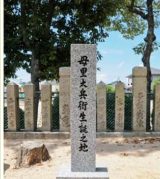
2 元宮八幡神社・母里太兵衛生誕の地碑