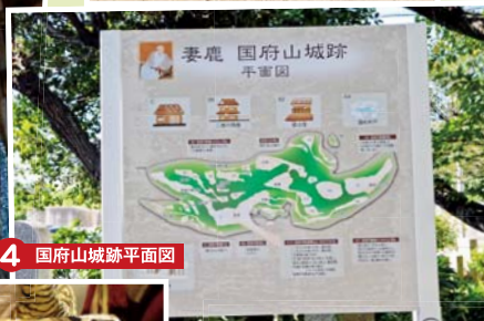
4 国府山城跡平面図