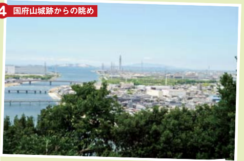
4 国府山城跡からの眺め