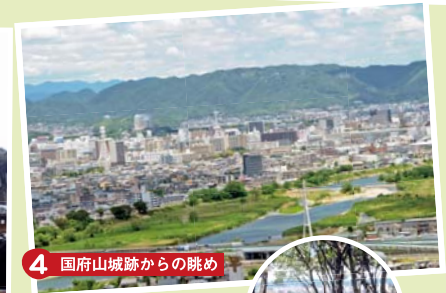
4 国府山城跡からの眺め