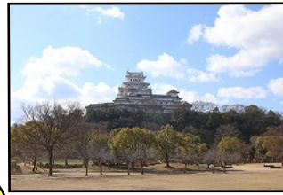
臨時駐車場周辺からの 姫路城

観光バス臨時駐車場(白鷺園跡) 利用可能時間 8:00 ~ 17:30 (駐車場への最終入場 16:00)