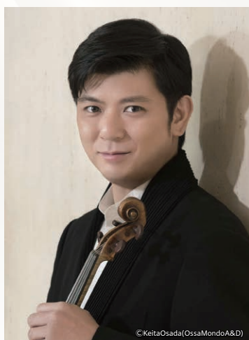
音楽監督/ヴァイオリン 檜本 大進