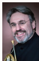
ホルン ラドヴァン・ヴエトロヴィチ