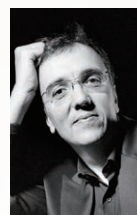
ピアノ エリック・ル・サージュ