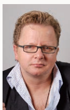
クラリネット ヴェンツェル・フックス