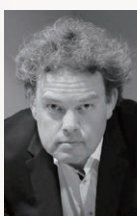
ヴィオラ ギャレス・ルベ