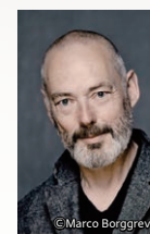
テノール マーク・パドモア