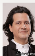
チェロ クラウディオ・ボルケス