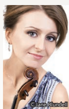
ヴァイオリン ナタリア・ロメイコ