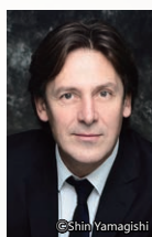
クラリネット ポール・メイエ