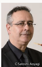
バスーン ジルベール・オダン