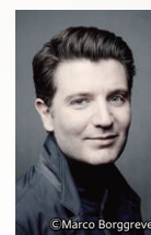
ピアノ アレッシオ・バックス