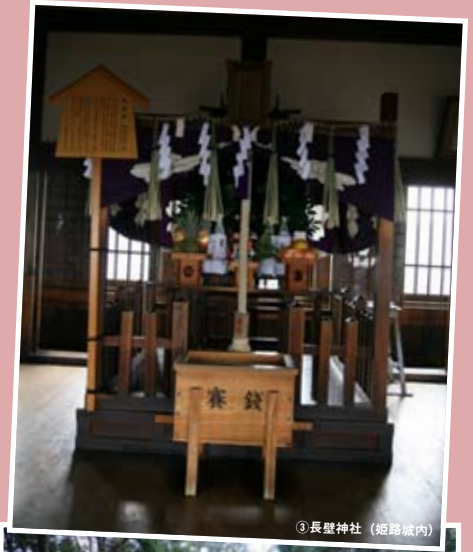
③長壁神社 (姫路城内)