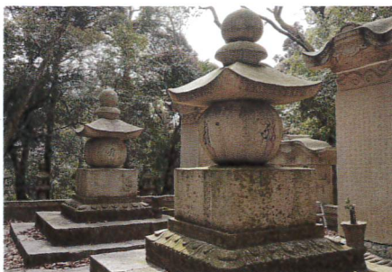
(手前)政邦墓塔 (奥)政邦正室墓塔

榊原政邦 1704(宝永元)年 姫路藩藩主となる。 1726(享保11)年 52歳没。翌1727年、遺言により増位山に埋葬。 天輪院 佐賀藩(肥前藩)藩主鍋島光茂女(綱茂養女)光・ 1695(元禄6)年 榊原政邦の正室となる。 1729(享保14)年57歳没。 同年、遺言により増位山に埋葬。