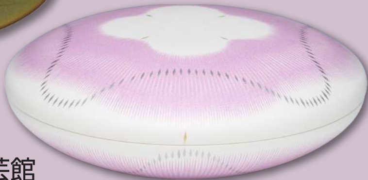
特別賞 [十四代柿右衛門記念賞] 金彩正燕支蓋器 (小山耕一)