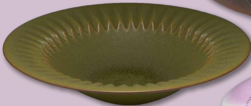
優秀賞 [日本陶芸美術協会会長賞] 若草釉鑄鉢「萌工」 (八兒祥葉)